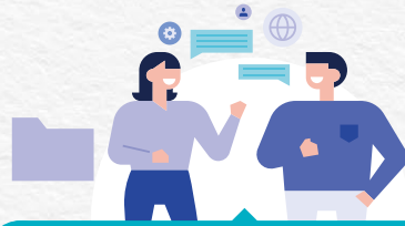
주민협의체 활동 지원