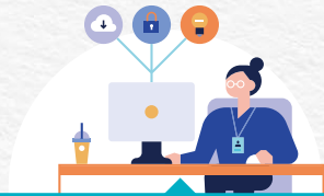
도시재생대학 교육운영 지원