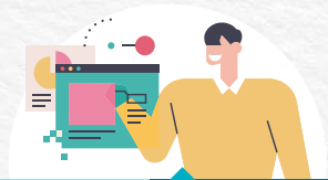
도시재생 자료수집 및 조사