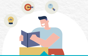
도시재생 사업계획 수립 지원